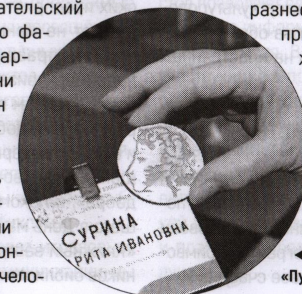
◀ Каждому члену клуба «Новые горизонты» специалисты «Пушкинки» выдают особый значок с изображением поэта