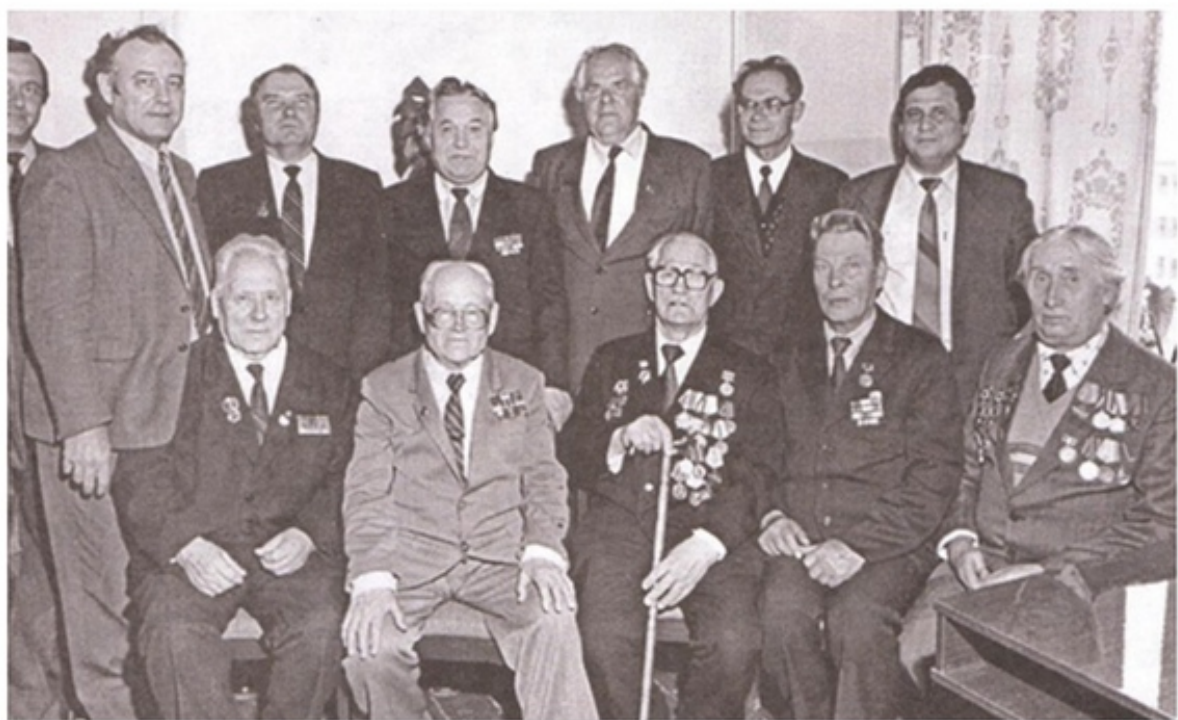
Встреча в Союзе писателей Мордовии с литераторами-фронтовиками