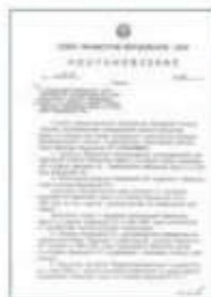
Постановление о присвоении статуса Национальной библиотеки