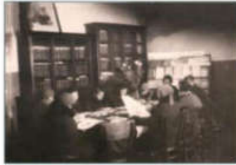
Читальный зал 20-х годов XX века