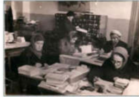
Отдел обработки в годы Великой Отечественной войны