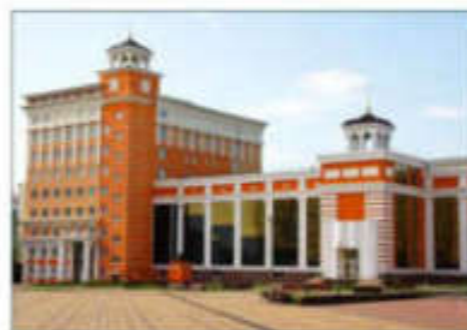
НБ им. А. С. Пушкина Республики Мордовия, 2014 г.