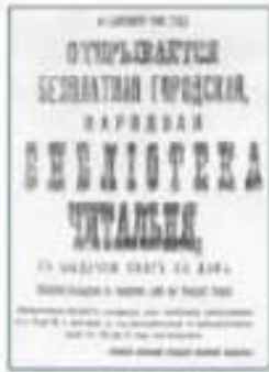
Афиша в открытии библиотеки-читальни