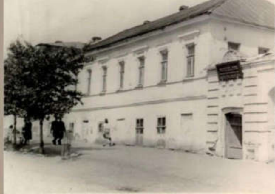
Здание Республиканской библиотеки им. А. С. Пушкина.

В 1940 году в работе библиотеки им. А. С. Пушкина характеризовался значительным ростом читательской работы. Всего за год библиотекой выдано 213.007 книг, а в 1939 году 275 тысяч. Книжный фонд увеличился на 25.000 томов. Проведены выставки: «Шалунья-Машинка», «Мирная Сибирь», «Семидесятилетие революции», «Сорок лет Великой Отечественной войны», «Книжкины друзья», «Славные герои войны», «Славные герои войны». В 1940 году в работе библиотеки им. А. С. Пушкина характеризовался значительным ростом читательской работы. Всего за год библиотекой выдано 213.007 книг, а в 1939 году 275 тысяч. Книжный фонд увеличился на 25.000 томов. Проведены выставки: «Шалунья-Машинка», «Мирная Сибирь», «Семидесятилетие революции», «Сорок лет Великой Отечественной войны», «Книжкины друзья», «Славные герои войны», «Славные герои войны».