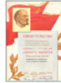
Светлоты и знания библиотека в Краю Пензы