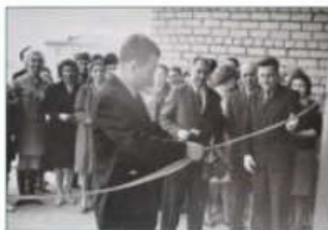
Открытие здания библиотеки на ул. Б. Хмельницкого, 26